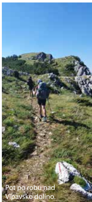
Pot po robu nad Vipavsko dolino.